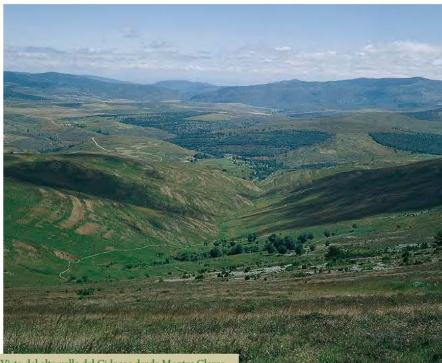
Vista del alto valle del Cidacos desde Montes Claros

ra un sendero que cruza el arroyo dentro del hayedo. Enseguida la pendiente del praderío se suaviza y lo cruza en dirección oeste a media ladera, en busca del Chozo de los Llanos. Más abajo de éste y en frente, desciende siguiendo la línea de máxima pendiente y, a pocos metros, toma a la derecha un ancho sendero entre retamas que se adentra de nuevo en el hayedo y, un poco más abajo, cruza el arroyo del Acebo. Tras cruzarlo, asciende