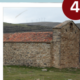
Ermita Ayuso Vizmanos

C: 5' Por carretera hacia Valloria: V: 2' (500m) parada entrada del campo C: 15' (1 km)