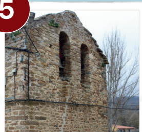
Iglesia de Santo Tomás Apóstol Valloria

V: 5' (2 km) Por carretera dirección Las Aldehuelas: V: 5' (3km)