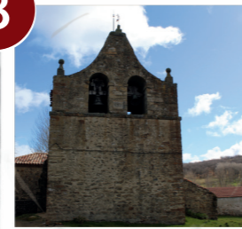
Iglesia San Bartolomé Palacio de San Pedro

V: 15' (13km) Por carretera SO-650 hacia San Pedro Manrique- Izquierda por SO-643: V: 15' (12km)