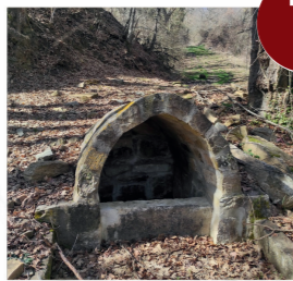
Fuente de Navabellida. Navabellida

V: 5' (3km) Por carretera dirección Navabellida- Carretera SO-615 luego a izquierda por SO-650: V: 15' (13km)