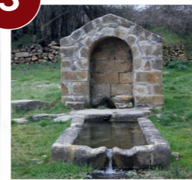
Fuente de Vizmanos Vizmanos

C: 5' Por carretera hacia Valloria: V: 2' (500m) parada entrada del campo C: 15' (1 km)