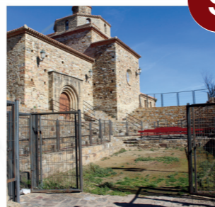
Ermita de La Virgen de La Peña. San Pedro Manrique