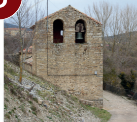
Iglesia de Nuestra Señora del Socorro. Las Aldehuelas

V: 5' (2 km) Por carretera dirección Las Aldehuelas: V: 5' (3km)