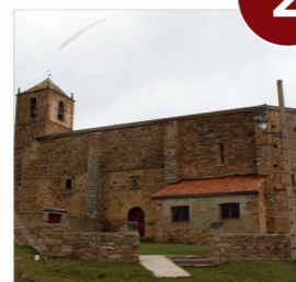
Iglesia de San Martín Vizmanos

C: menos de un 1' Por carretera dirección Vizmanos: V: 15' (10km) ➔ C: 5' (500 mts)