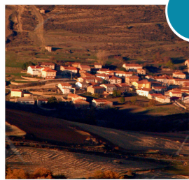
Santa Cruz de Yanguas