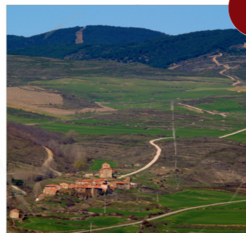
Bretún ( Documental "El Cielo Gira")

V: 10' (9km) Desde San Pedro Manrique iremos por la SO-650 hasta llegar a Oncala. V: 10' (11km)