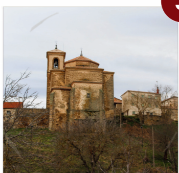
Oncala ( Película "Total")

Carretera hacia la SO-630. En ella giramos a la derecha dirección San Pedro Manrique V: 10' (9km)