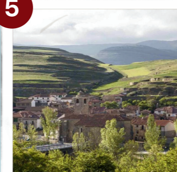
Villar del Río ( Documental " El Cielo Gira")

V: 25' (22km) Volveremos por la carretera y en el primer cruce continuaremos recto dirección Villar del Río. V: 5' (4km)