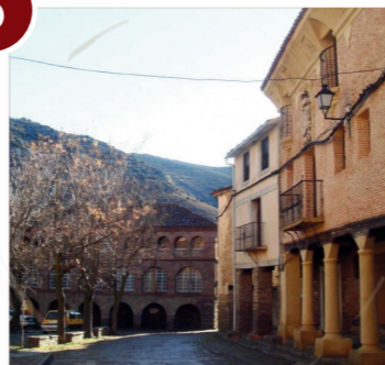
Yanguas (Película "Total")

V: 5' (4km) Desde Villar del Río cogemos la SO-615 dirección Yanguas. V: 5' 4km