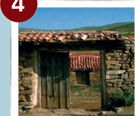
Rancho y Corral Oncala