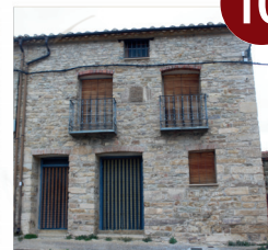
Casa Blasonada Familia Duro Vizmanos

V: 10' (5 km) Parar en el pueblo V: 5' (4 km)