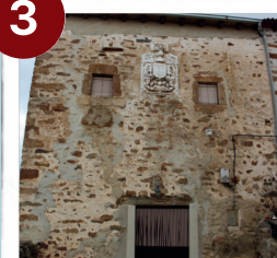
Casas Blasonadas Oncala

Volver por SO-615 hasta Puerto de Campos- Izquierda dirección Los Campos