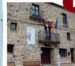
Museo del Pastor Oncala