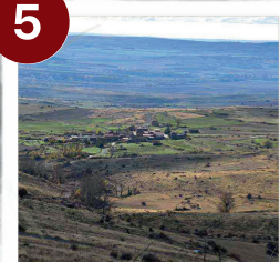
Cañada Real Soriana Puerto de Los Campos