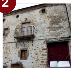
Casa del Arzobispo