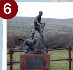
Monumento al Trashumante Los Campos

V: 5' (3 km) C: menos de 1' por el municipio