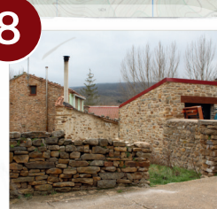
Casa de Merineros Valloria

Abreviaciones: C: Caminando | V: Vehículo