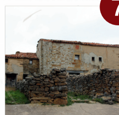
Casa de Merineros Los Campos

V: 5' (3 km) C: menos de 1' por el municipio