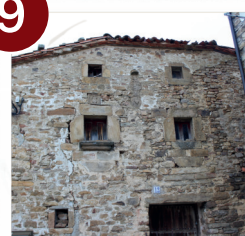
Casa Blasonada Ledrado

C: menos de 1' Dirección Valloria V: 5' (5 km)