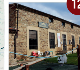
Casa Blasonada Santa Cecilia

V: 5' (4 km) Dirección Verguizas: V: 5' (5km)